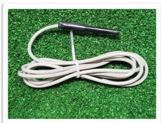
Emettitore Mod.R200 per contatore ADIGE e TAMIGI versione orologeria standard (PLR)